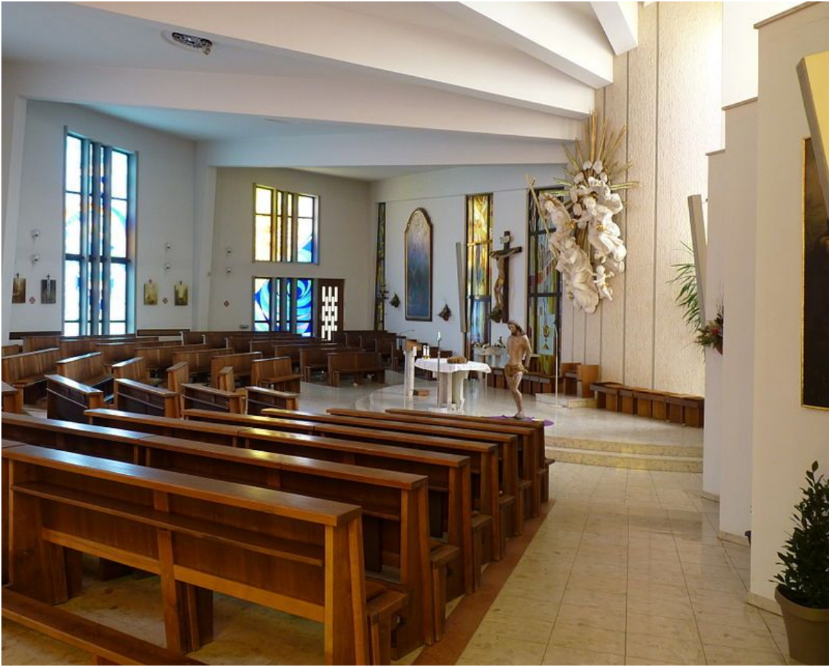
Petr Peňáz, 25. října 2020